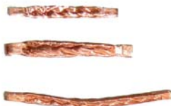
Fabrication d'éléments tresse