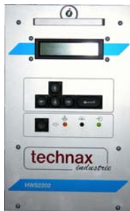
Séquence de soudage