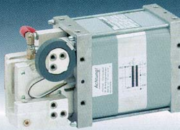
Transformateur 180 kVA