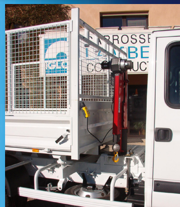
Montage dos cabine, fixation sur les longerons.