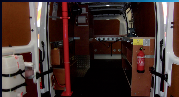
Montage fourgon avec fixation haute et basse.