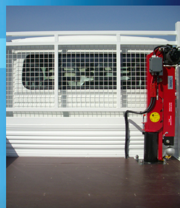
Montage benne avec béquille.