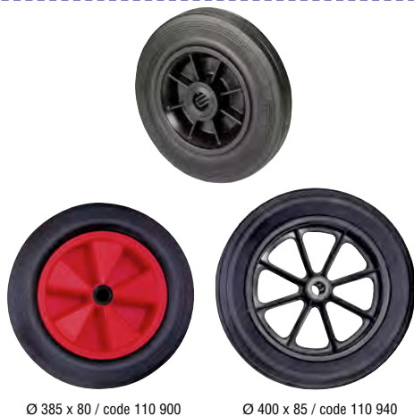
Ø 385 x 80 / code 110 900

Roue à bandage plein en CAOUTCHOUC NOIR pressé sur jante PLASTIQUE (CA/PP - 11) . Alésage lisse ou roulement à rouleaux.