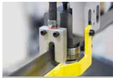
Buse de micro-pulvérisation