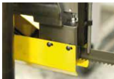
Bloc de guidage ruban