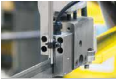
Palpeur déviation ruban

PROLINE 280 H / PROLINE 350 H PROLINE 450 H