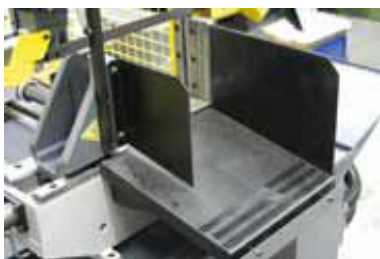
Guide pièces coupées