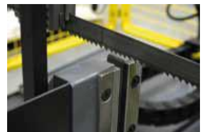
Etau principal serrage Amont/Aval